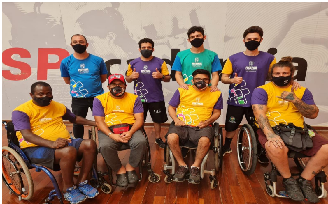
PARTICIPAÇÃO FESTIVAL PARALÍMPICO 2021.

Finalizamos este ano ainda mais conscientes da importância de continuarmos juntos, lutando para o crescimento e união de nossa associação, com a ciência dos aspectos que precisamos trabalhar melhor e das batalhas que precisamos vencer. Porém, carregamos a certeza de que estamos no caminho certo e devemos prosseguir, construindo assim uma ADEACAMP cada vez mais forte.