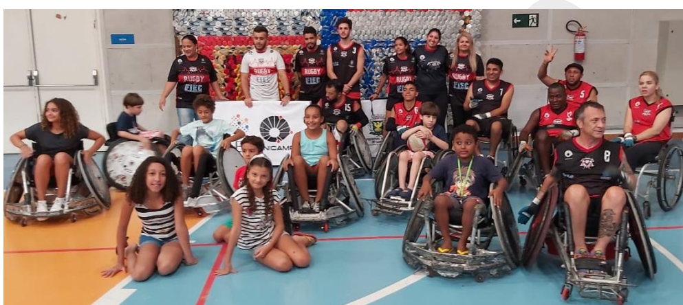
Imagem 1- Vivência no SESC Verão (São José dos Campos/SP).

Finalizamos este ano ainda mais conscientes da importância de continuarmos juntos, lutando para o crescimento e união de nossa associação com a ciência de aspectos que precisamos trabalhar melhor e das batalhas que precisamos vencer. Porém, carregamos a certeza de que estamos no caminho certo e devemos prosseguir, construindo assim uma ADEACAMP cada vez mais forte. Este relatório apresenta um resumo de nossas ações de 2020, reforçando a importância de continuarmos cada vez mais unidos.