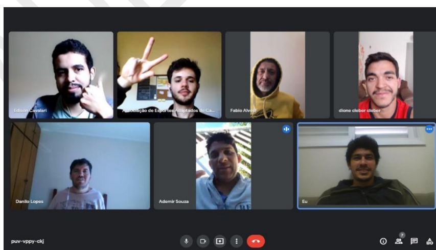
Imagem 3 - Captura de tela de uma das sessões de treino online.

Porém, no dia 23 de março de 2020, recebemos a notícia que a pandemia de COVID-19 estava avançando no Brasil. A preocupação de preservação da vida e na tentativa de diminuir o contágio, a direção da Faculdade de Educação Física da UNICAMP suspendeu todas as atividades desenvolvidas em seus institutos e departamentos. O medo e as incertezas tomaram conta de todos nós, tendo em vista que não tínhamos noção de como seriam nossas vidas, tamanha proporção que o contexto pandêmico vinha se apresentando mundialmente.