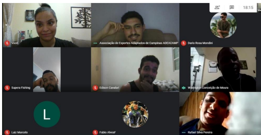
Imagem 5 - Captura de tela de uma sessão de treino online.

Ao fim do Ano de 2020, o cenário que se via era nada promissor. Alinhado ao aumento do número de mortes, as pessoas foram orientadas a continuar com o isolamento social, levando ao cancelamento de todos os campeonatos das modalidades que representávamos, não restando outra alternativa para além do que já estávamos nos propondo a fazer: Continuamos com nossos treinos online e assim seguirmos esperando que as pesquisas em vacinas que controlariam o vírus surgissem, na esperança de um 2021 diferente de tudo aquilo que vivemos em 2020.