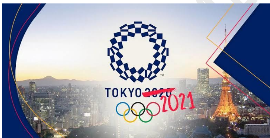
Imagem 4 - Imagem divulgação do adiamento dos Jogos Olímpicos de 2020.

Após alguns meses de incerteza dos rumos que tomaria a pandemia de COVID-19, percebemos que o isolamento social seria prolongado e diante da falta de perspectiva de retorno sentimos a necessidade de, através de ferramentas tecnológicas e sociais, voltar aos treinamentos. Pensando além do momento que poderíamos retornar, julgamos fundamental manter a proximidade entre os envolvidos, servindo como aliados para superação do isolamento social, somando a questão mental à parte física já trabalhada.