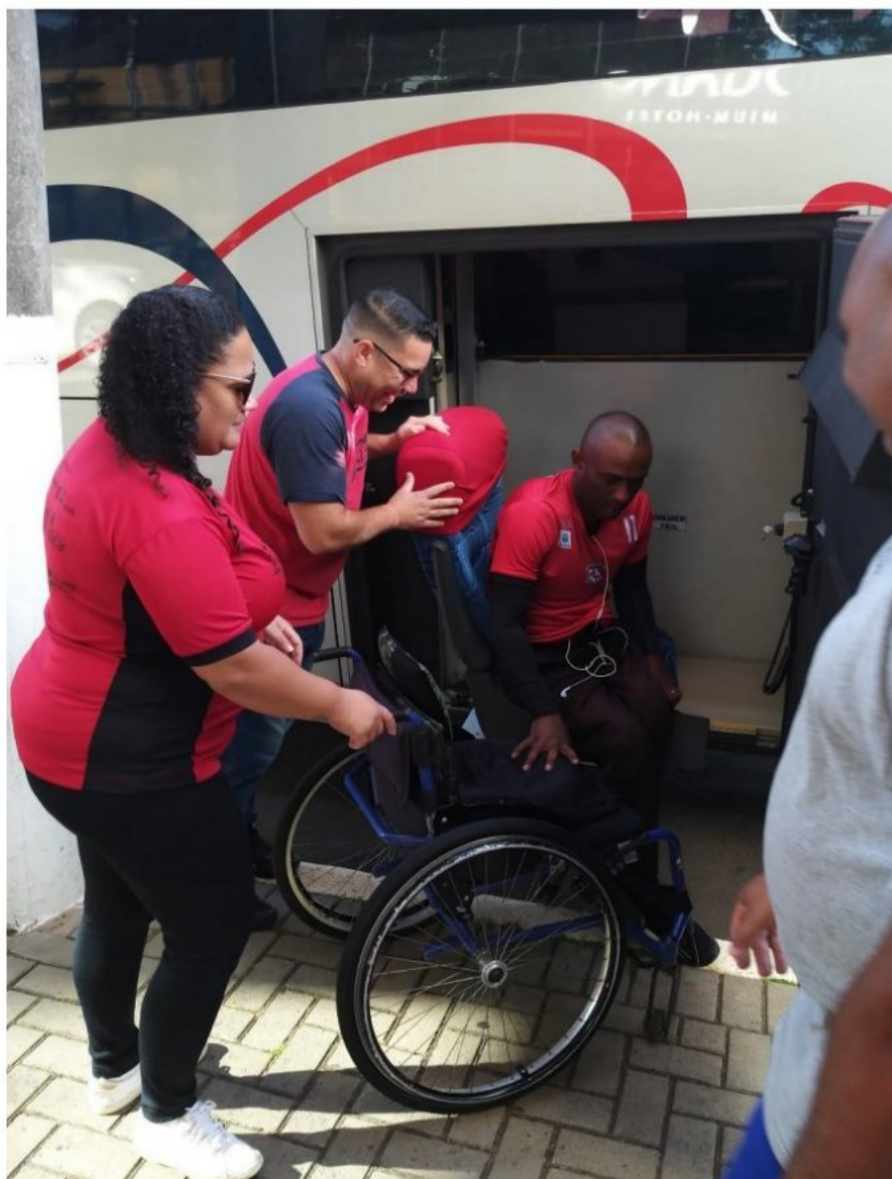
Enfermagem auxiliando na transferência do atleta

Os recursos do projeto possibilitaram a contratação de profissional de enfermagem para os cuidados preventivos e de vida diária dos atletas com deficiência. Ressalta-se que os referidos cuidados possibilitaram melhor qualidade de vida durante a competição, trazendo condições para o desenvolvimento da performance máxima da equipe.