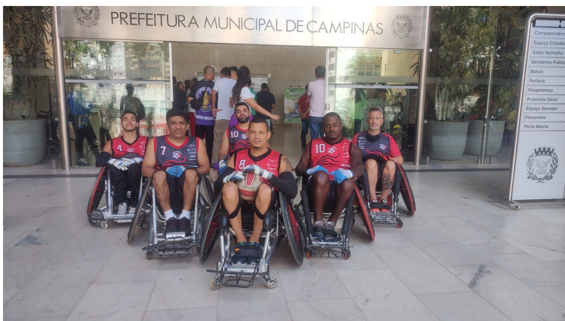
01/09/2023 – Participação da Equipe ADEACAMP, no setembro Verde com o tema: “CAPACITISMO – palavras que excluem, atitudes que incluem.” Local: Paço Municipal, da Prefeitura de Campinas, Av. Anchieta, 200, Centro, Campinas SP.