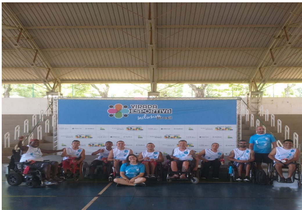
13/12/2023 a 15/12/2023 – Participação das EQUIPES ADEACAMP, na Virada Esportiva Inclusiva Brasil.

Local: Faculdade de Educação Física da PUC Campinas, Av. Cardeal Dom Agnelo Rossi, 230-362, Parque dos Jacarandás, Campinas SP.