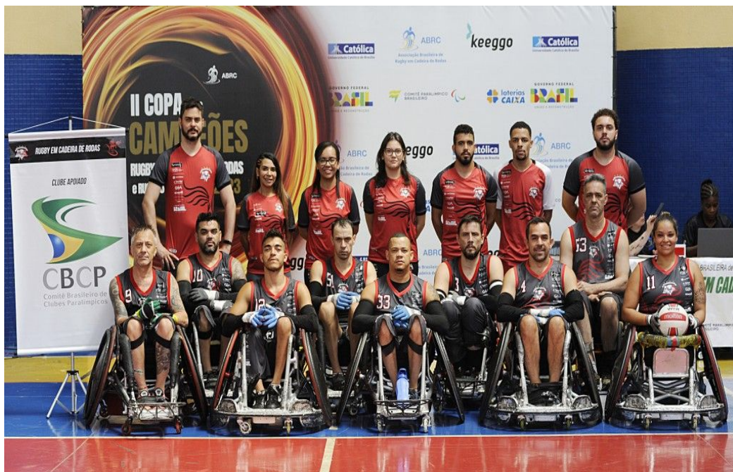
06/12/2023 a 11/12/2023 – participação da EQUIPE ADEACAMP, na II Copa dos Campeões de Rugby em cadeira de Rodas, com o apoio do Comitê Brasileiro de Clubes Paralímpicos CBCP, na cidade de Brasília DF.